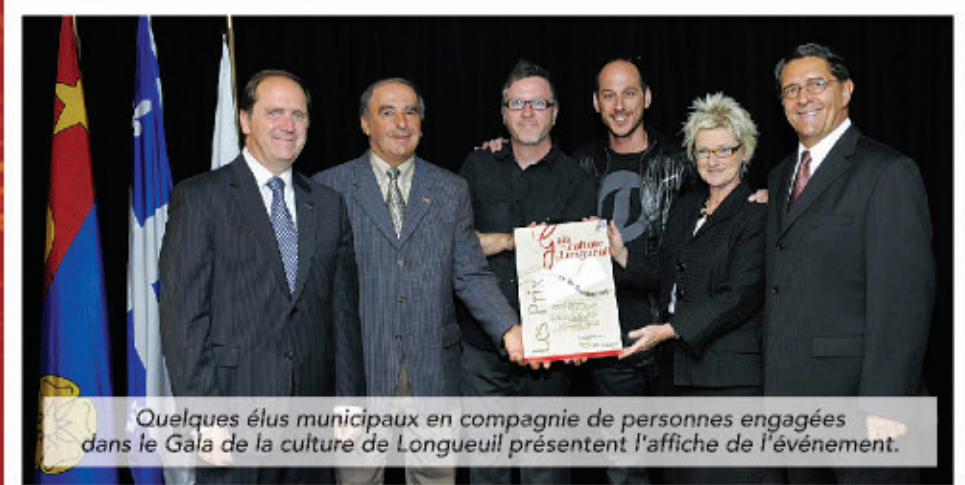
Quelques élus municipaux en compagnie de personnes engagées dans le Gala de la culture de Longueuil présentent l'affiche de l'événement.

URGENCE: 450-583-6056 • BUREAU : 450-652-5056