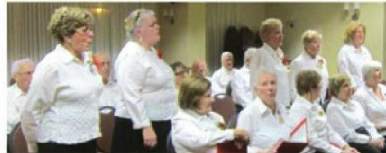
13 mai 2016 Les Cœurs chantants