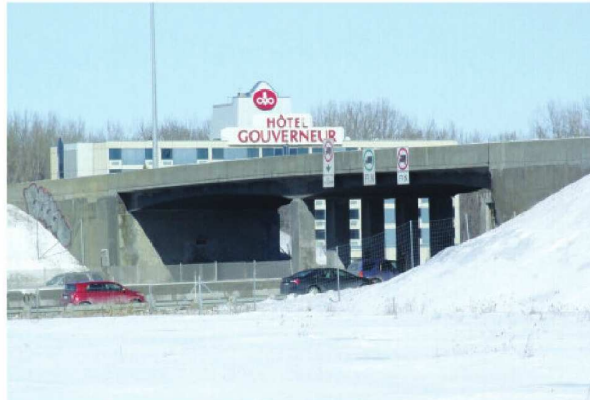
Le pont de la rue de l'Île-Charron

Pont local à deux voies, cette infrastructure a une longueur de 70 m. Il relie l'Île Charron, porte d'entrée du parc des Îles-de-Boucherville, à l'autoroute 25. Les plus récents relevés indiquent que quelque 130 000 véhicules transitent sur l'autoroute 25 depuis le pont-tunnel en direction de la Rive-Sud ou vers Montréal, dans l'autre direction. Ces voitures et camions circulent sous le pont de la rue de l'Île Charron.