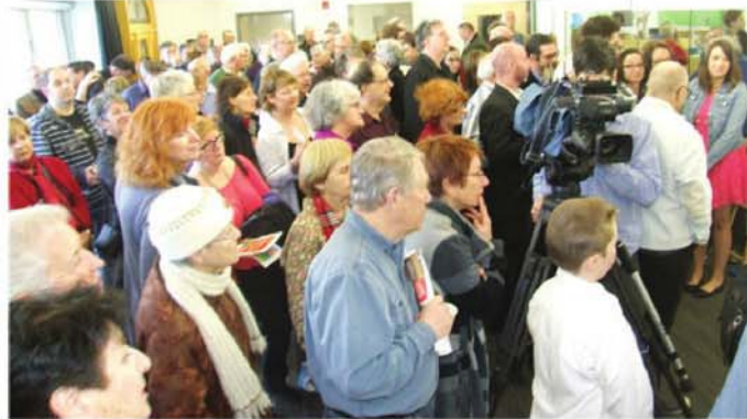
Le Déjeuner du maire a attiré un grand nombre de citoyens à la bibliothèque municipale.

Le projet a été subventionné par le ministère de la Culture et des Communications. Il s'est inscrit dans l'entente de développement culturel de la municipalité. Les archives photographiques de la Société d'histoire des Îles-Percees, récemment acquises dans la collection municipale, ont servi de référence dans la création de l'oeuvre d'art.