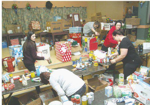
Les bénévoles étaient fort occupés à préparer les paniers de Noël au sous-sol de l'église Saint-Sébastien.

L'organisme apprécie au plus haut point la généreuse contribution de nombreux donateurs: employés d'une institution financière, élèves de l'école Antoine-Grouard et de l'école secondaire De Mortagne de même que les nombreux bénévoles provenant des établissements scolaires et des entreprises qui s'impliquent dans cette cause dont ceux provenant du CABB. «Nous tenons à tous les remercier sincèrement pour leur apport», termine la présidente du CEB.