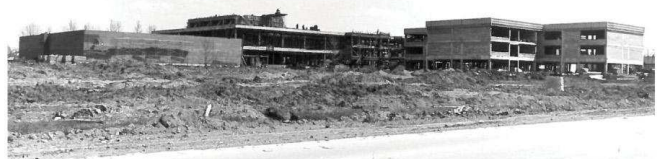
Construction de l'école secondaire De Mortagne.