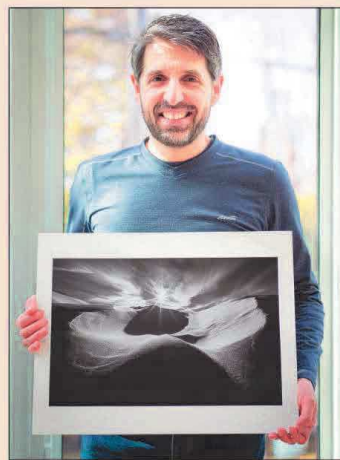
Jean-François Ménard a été sélectionné par l'Association canadienne d'art photographique parmi les quinze photographes qui représenteront le Canada à la compétition internationale des Quatre Nations 2020.